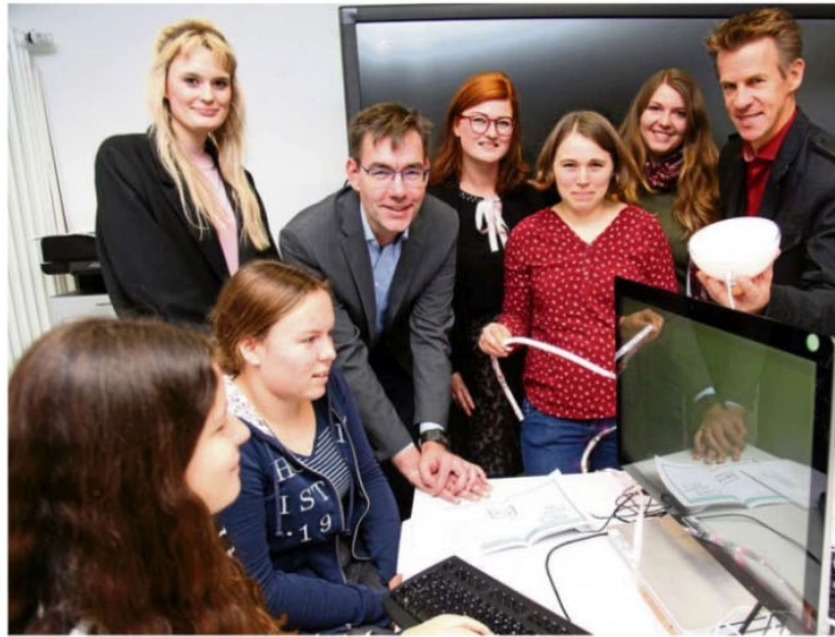
Gespannt verfolgen Leiter und Teilnehmer des Camps die Fortschritte bei den Projekten.

Ein paar Stockwerke unter dem Labor sind unterdessen im Technikum zwei veredelte Autos (Modelle: E 800 und GLE 400) der Firma Bra-