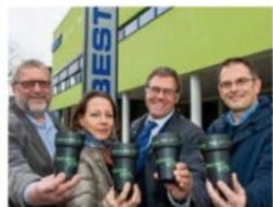
Mewa ist ab sofort neuer Kooperationspartner.

Die Best sucht unter dem Motto „Bewusst genießen“ weitere Kooperationspartner, um den Pappbechern den Kampf anzusagen.